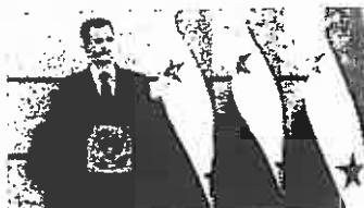
Assad sprak vanuit de universiteit in Damascus het Syrische volk toe.

Assad deelde in zijn analyse van de gewelddadige onrust de deelnemers in drie groepen in: vreedzame mensen met gerechtvaardigde zorgen, ongeveer 64.000 vanden en tot slot radicale, godslasterlijke intellectuelen. Hij waarschuwde dat er geen politieke oplossing mogelijk is, zo lang er sabotage en chaos