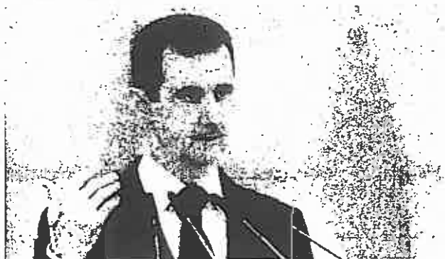
President Bashar al-Assad

UPDATE. De Syrische president Bashar al-Assad heeft vandaag in een toespraak geen enkel uitzicht geboden op een uitweg uit de bloedige strijd waar zijn regime het land in heeft gemanoeuvreerd.