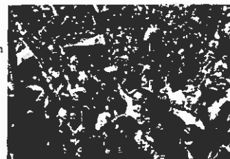
Aanhangers van Assad juichen hem voor de universiteit toe.