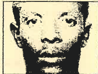
Alishukiwa kuhusika na mlipuko ya balozi za Marekani katika mji ya Nairobi na Dar es Salaam

Mwaka 2007, alinusurika shambulio la ndege za kivita za Marekani katika kijiji cha Haya, kusini mwa Somalia, karibu na mji wa Ras Kamboni.