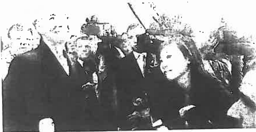
Christine Lagarde akitangaza kuw ania kuongoza IMF

Mexico imewasilisha jina la mkuu wa benki kuu Agustín Carstens, wakati mataifa ya Afrika Kusini na Kazakhstan, yanayoungwa mkono na Urusi, zaweza kuwasilisha majina ya wagombea wao. Waziri wa fedha wa Brazil Guido Mantega amesema kuwa uongozi wa IMF wapaswa kutolewa kukizingatiwa Ujuzi na utendaji kazi wa mgombea hapana kuzingatiwa Uraia wake. Katika kujibu, Christine Lagarde alisema kwamba kuwa raia wa Ulaya "kusichukuliwe kama kudhohofika"