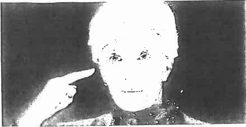
Waziri wa Fedha wa Ufaransa Christine Lagarde

Source URL: http://www.kiswahili.rf/generali/20110520-christine-lagarde-waziri-wa-fedha-wa-ufaransa-huenda-akamrithi-dominique-strass-k-0