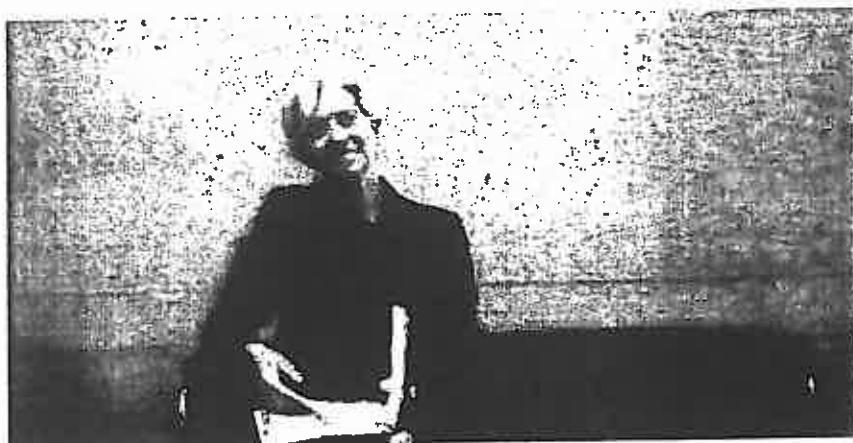
Christine Lagarde waziri wa uchumi wa Ufaransa anaew ania uongozi wa IMF

Christine Lagarde anashindana na Agustín Carstens ambae upande wake alisikilizwa Jumanne Juni 21 na Wanachama ishirini na nne. Wanachama hao watatakiwa kupata muafaka kati ya wagombea hao wawili. Ikiwa muafaka utakosekana watatakiwa kupigas kura na kumtangaza mshindi Juni 30